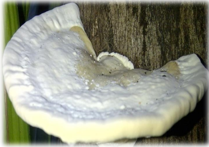
Gambar 5.5 Foto jamur Daedaleopsis eff. Confrag